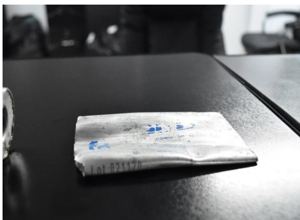
Gases Lacrimógenos vencidos